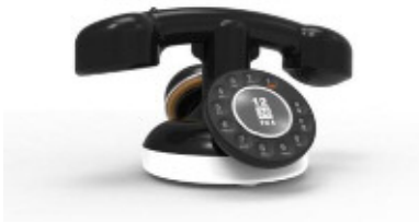
Le téléphone NeoRetro par Orange

Depuis sa constitution, le patrimoine et en particulier la Collection Historique d'Orange ont été maintes fois sollicités pour défendre les intérêts de l'entreprise. La plupart du temps, il s'agissait d'actions en justice menées, à son encontre, principalement sur des brevets déposés. Grâce à nos fonds documentaires et historiques nos adversaires ont été déboutés.